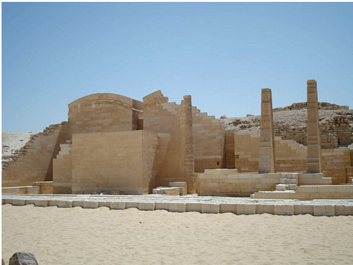
Vue de la chapelle "des vivants" depuis la cour principale