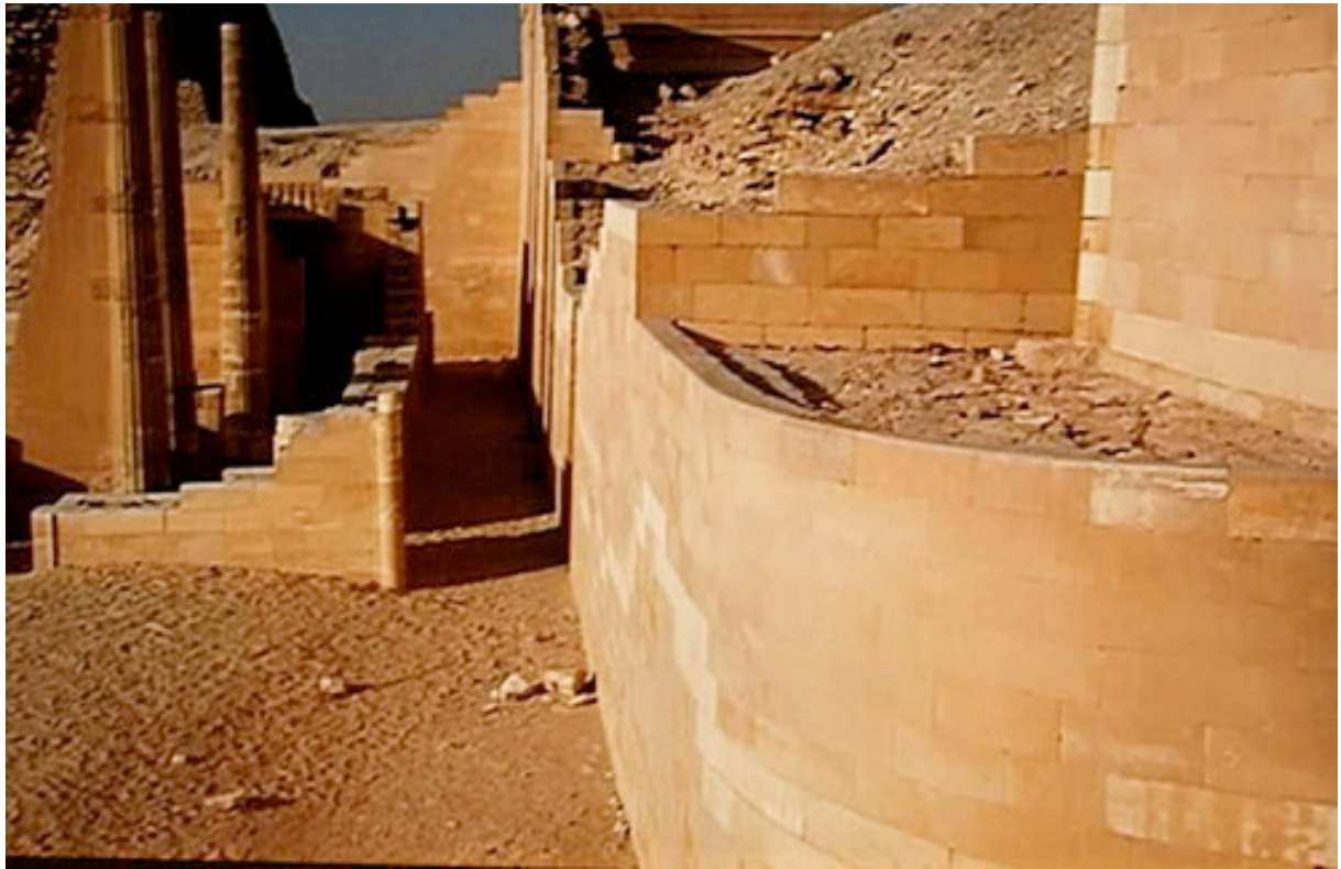
Le mur courbe