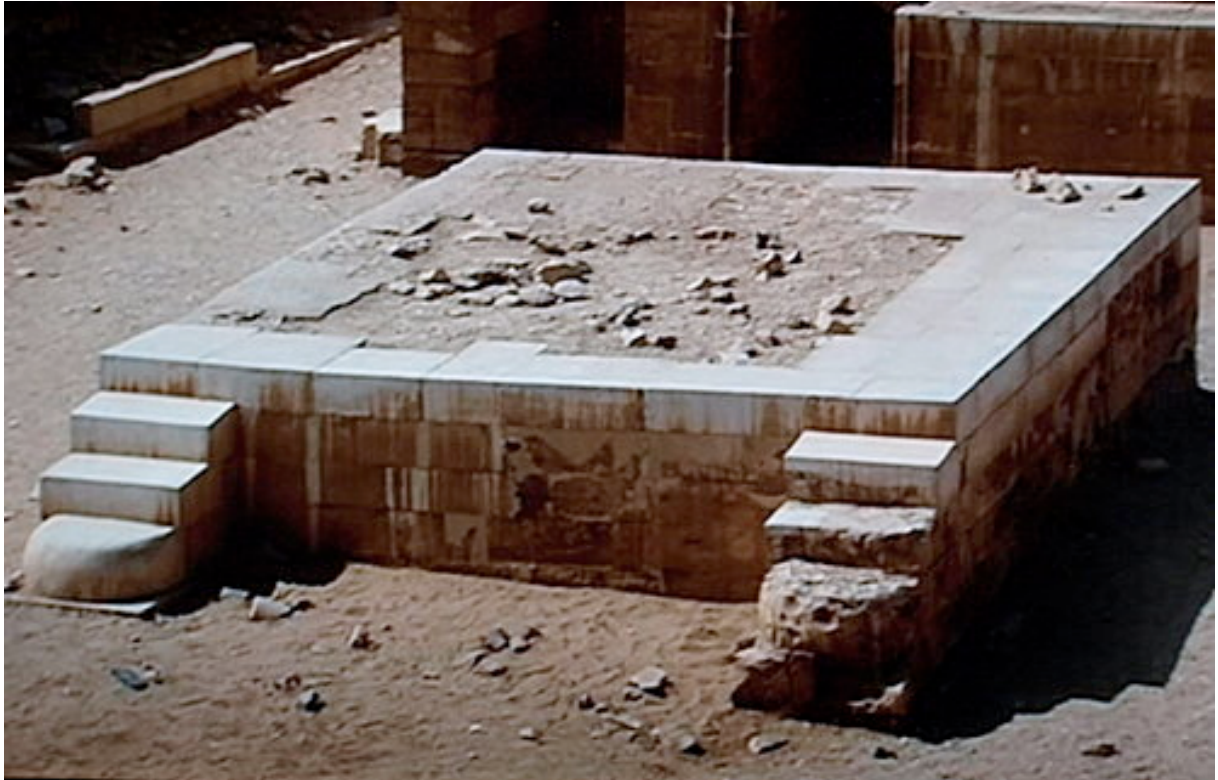
Double trône représentant les deux royaumes

espace personnel. Une autre façon de consolider l'unité du royaume. Le roi y revenait éternellement se faire couronner deux fois, une fois pour le Sud, et une autre pour le Nord.