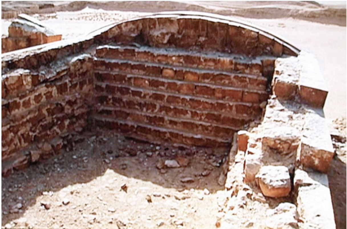
L'intérieur d'une des chapelles, remplies de gravats

Par contre, au-devant de chacune d'elle l'entrée est faite d'une sorte de chicane, comme pour en rendre l'accès plus difficile, mais encore une fois les portes et les barrières de bois (symbolisées en pierre ) sont ouverte pour l'éternité, ces murets sont une façon de matérialiser le trajet rituel qui mène à des niches, dans lesquelles se trouvaient des statues du roi et qui s'arrêtent là. Les chapelles rappellent seulement les chapelles provisoires qu'ont érigéait pour la fête Heb Sed. Dans le monde des morts, l'apparence suffit, rappelons qu'elles sont pleines et factices.