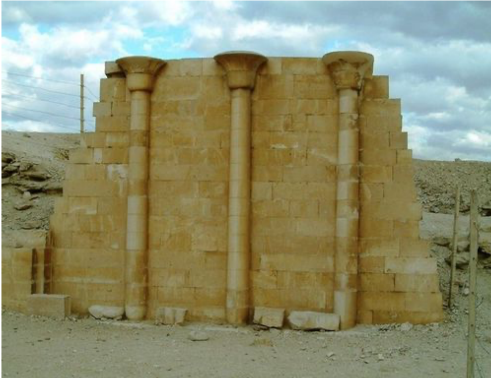
Colonnes imitant le papyrus

Tous les éléments font signes de symboles, les colonnes en forme de papyrus incarnent le delta du Nil. Ce sont des instantanés de ce qu'est l'architecture du moment, utilisant terre et bois, matériaux périssables que la pierre veut imiter. Les plafonds du couloir d'entrée ont ainsi l'apparence de rondins de bois, les colonnes de ce même couloir donnent l'impression de faisceaux de roseaux, d'où leur appellation dite fasciculées.