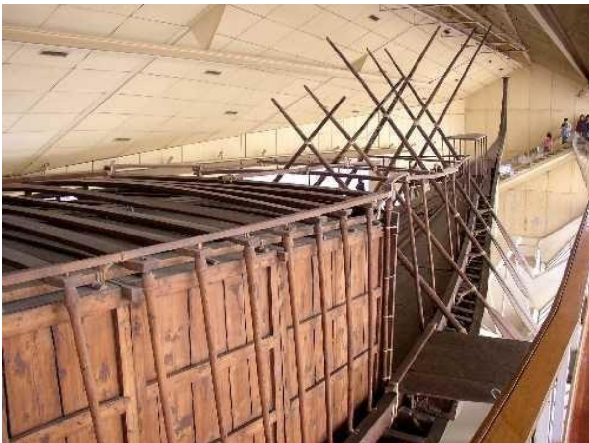
Les appartements du roi.