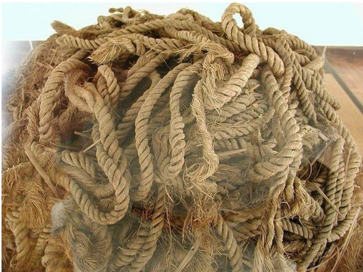
Les cordages originaux vieux de 4500 ans.