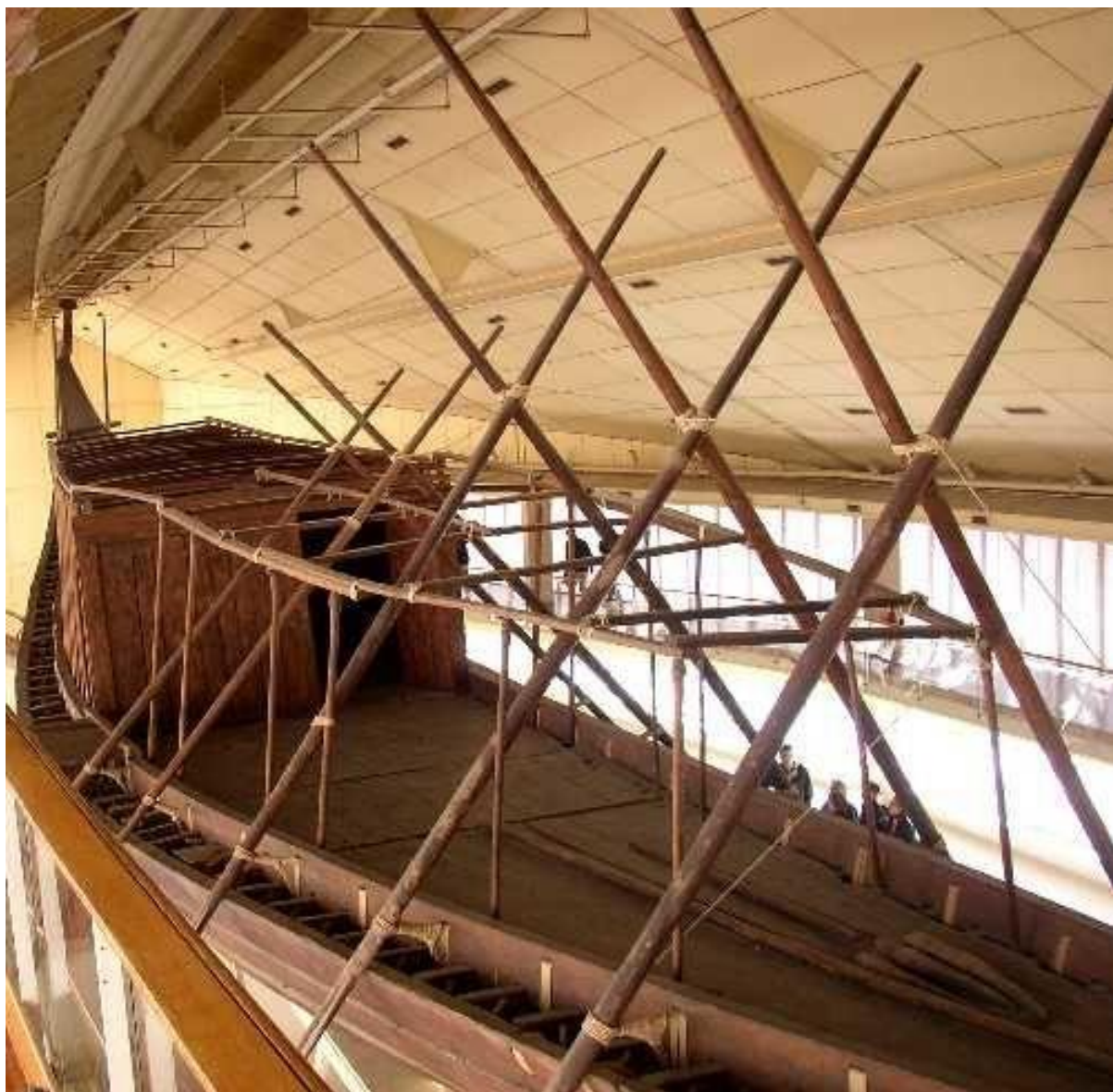
5 paires de rames.