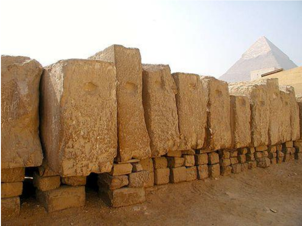
Ces blocs obstruaient la fosse à barque où elle a été découverte.