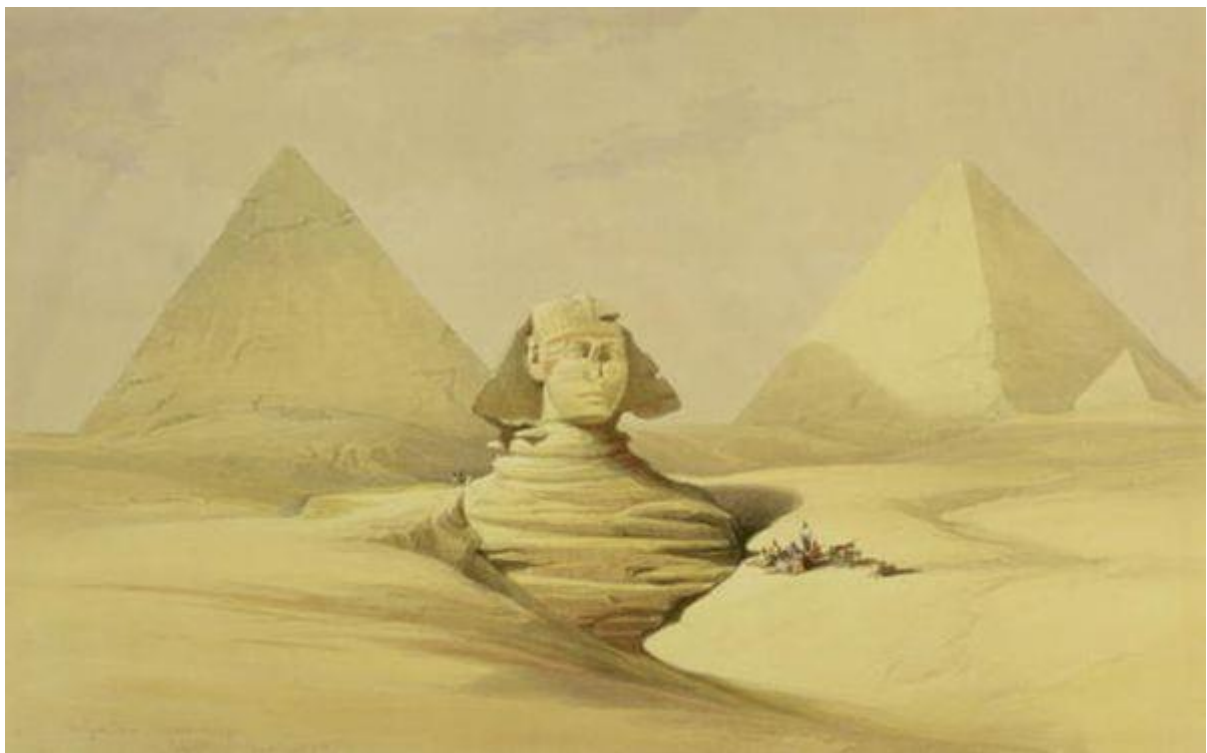
Tel que le voyait David Roberts au 18ème siècle, on voit bien que le sphinx était très largement ensablé.