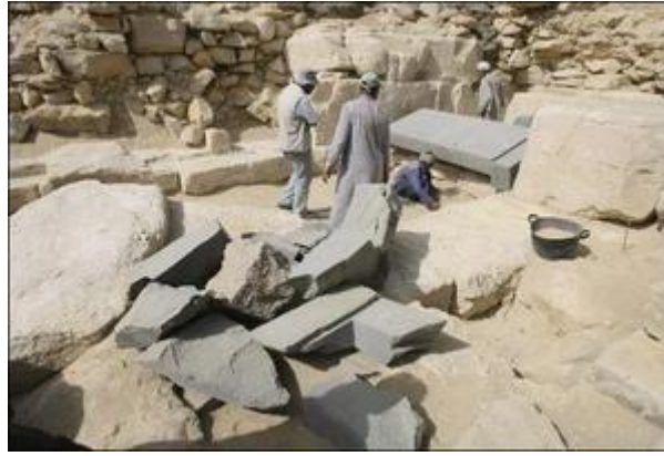
Les restes du sarcophage lors des fouilles de 2008.

La pyramide est une pyramide à faces lises, elle est située juste à l'Est de celle de Têti.