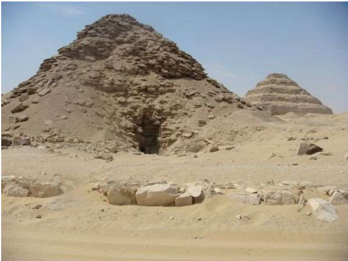
La pyramide du roi avec celle de Djoser en arrière-plan.

Le temple funéraire était construit en calcaire de Tourah et en grès. Les piliers, les portes et les colonnes étaient en granit, le basalte a été utilisé pour les dalles. Malgré son emplacement original, il restera le seul construit de cette manière dans l'histoire, le temple possède tous les éléments qui étaient standards à l'époque. Une porte donne à un vestibule à l'Est. Au Sud de celui-ci, des magasins. Une porte dans un coin donne sur un autre vestibule possédant des piliers de granit. Ensuite, nous tombons sur une cour ouverte à colonnes en granit portant la titulature du roi, elle était pavée de basalte. On y a retrouvé une tête colossale du roi en granit. Il y avait deux portes dans cette cour, elles menaient à un petit hall à colonnes qui ensuite donnait sur un sanctuaire à 5 chapelles. Nous ne connaissons pas grand-chose de la décoration intérieure du temple, mais les quelques objets découverts prouvent que cette décoration devait être de grande qualité.