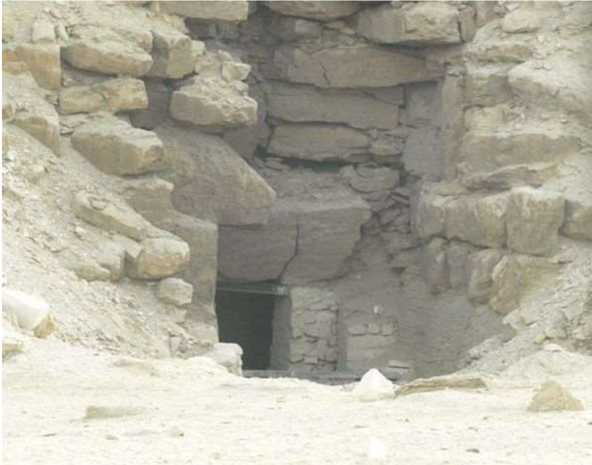
Gros plan sur l'entrée de la pyramide