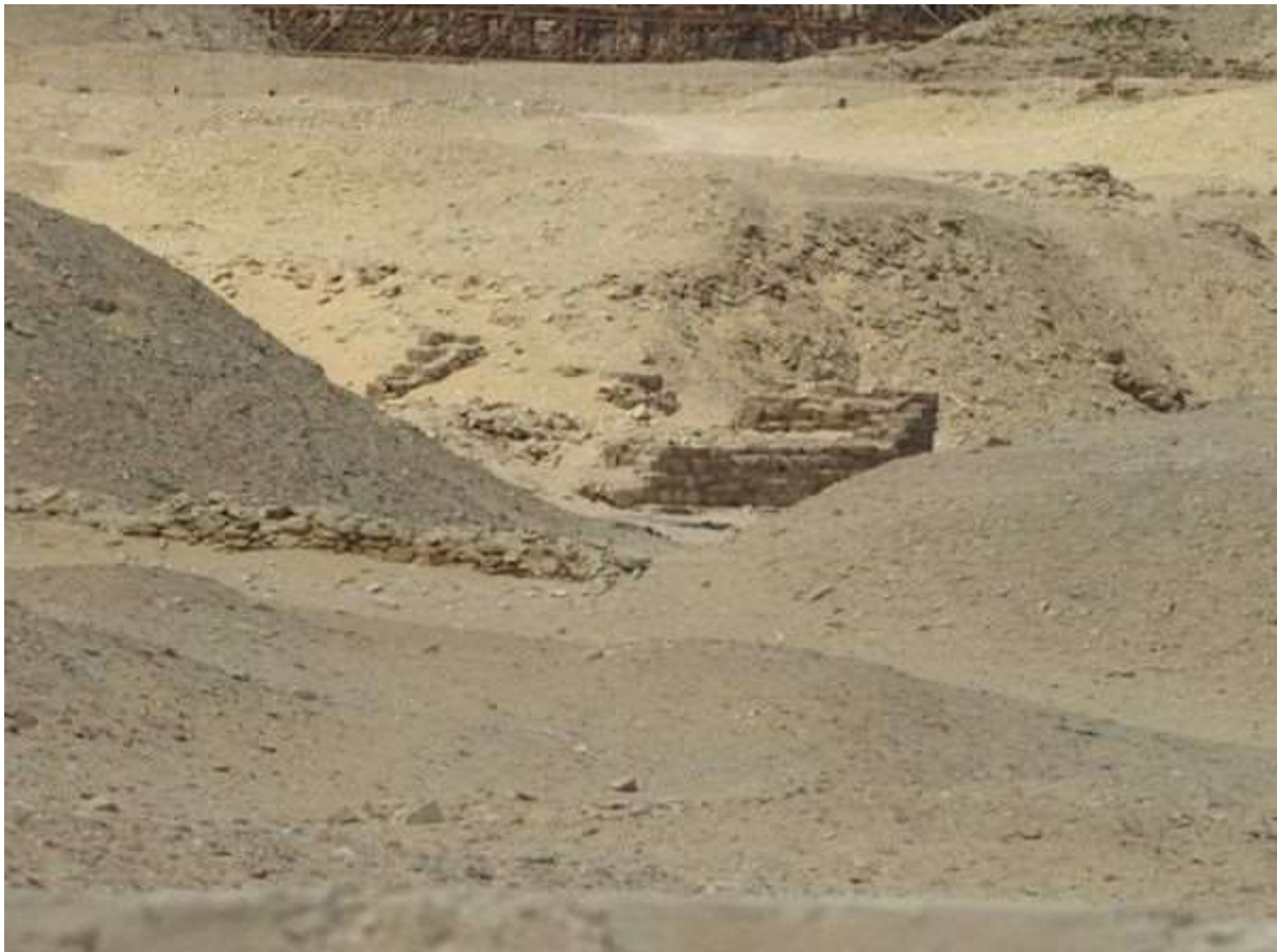
Les restes du temple funéraire de la reine.