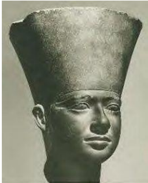
La tête de statue du roi Ouserkaf retrouvée dans le temple.

Le temple n'était pas orienté vers les points cardinaux, mais plutôt vers la cité d'Héliopolis, la ville du culte solaire.