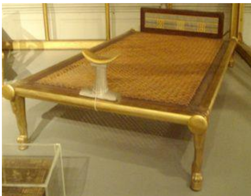
Le lit en bois doré