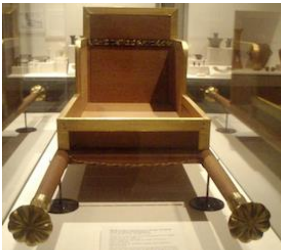
La chaise à porteur en bois doré